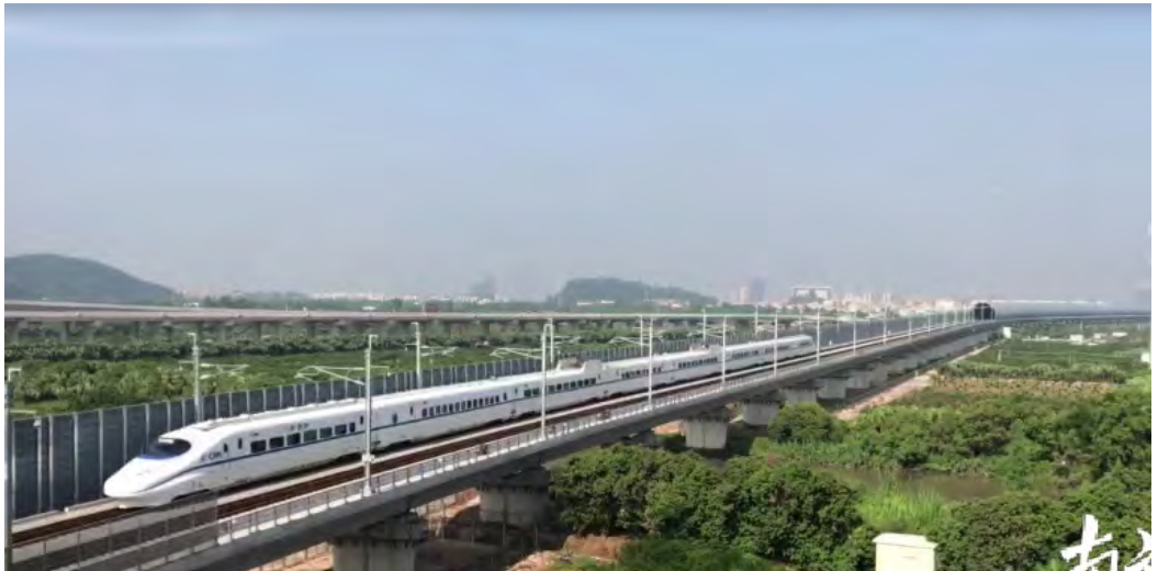
Рис. 1. Эстакада ВСМ малой высоты в Китае.

актуальность данной проблемы ограничена малыми объёмами их строительства [8]. Объём же строительства, например, в проекте двухпутной ВСМ «Москва–Казань» составлял 760 км, при этом расположение трассы предполагалось в достаточно однородных условиях с перспективой продления до Екатеринбурга [9, с. 1].